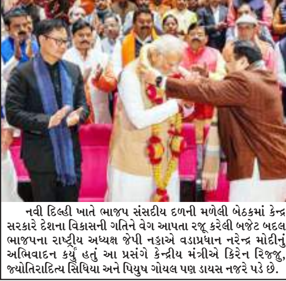
નવી દિલ્હી ખાતે ભાજપ સંસદીય દળની મળેલી બેઠકમાં કેન્દ્ર સરકારે દેશના વિકાસની ગતિને વેગ આપતા રજૂ કરેલી બજેટ બદલ ભાજપના રાષ્ટ્રીય અધ્યક્ષ જેપી નડ્ડાએ વડાપ્રધાન નરેન્દ્ર મોદીનું અભિવાદન કર્યું હતું. આ પ્રસંગે કેન્દ્રીય મંત્રીએ કિરેન રિજ્જુ, જ્યોતિરાદિત્ય સિંધિયા અને પિયુષ ગોયલ પણ ડાયસ નજરે પડે છે.

આવ્યું છે. પોલીસ દ્વારા મળેલી માહિતી પ્રમાણે કોઈ અજાણ્યા વ્યક્તિએ પોલીસે સતર્ક રહીને બંને સંસ્થાઓની સુરક્ષા વ્યવસ્થાની સમીક્ષા કરી રહી છે અને દરેકને એલર્ટ રહેવા માટે કહેવામાં આવ્યું છે. કલાશ હાથ ધરી હતી. આ સાથે જ મેન્ટલ હોસ્પિટલ અને ઈન્દિરા ગાંધી મેડિકલ કોલેજ અને હોસ્પિટલમાં તૈનાત સુરક્ષા વ્યવસ્થા સઘન કરવામાં છે અને દરેક વ્યક્તિ પર નજર રાખવા માટે કહેવામાં આવ્યું છે. લગભગ એક મહિના અગાઉ પણ કંટ્રોલ રૂમમાં આવો જ એક કોલ આવ્યો હતો જેમાં આર.એસ.એ સહે ડકવાર્ડરને ઊડાવી દેવાની ધમકી આપવામાં આવી હતી. આ પછી કણાટકના એક ગુનેગારે કેન્દ્રીય મંત્રી નીતિન ગડકરીને પણ જાનથી મારી નાખવાની ધમકી આપીને ખંડણી માંગી હતી. આવા વારંવારના ધમકીભર્યા કોલથી પોલીસ વિભાગની ચિંતા વધારી દેવામાં આવી છે.