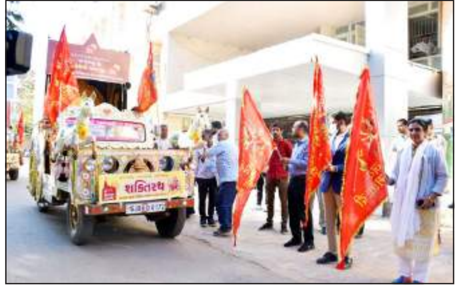
શ્રી ૫૧ શક્તિપીઠ પરિક્રમા મહોત્સવ અંતર્ગત જિલ્લા કલેક્ટરે માં અંબાના રથનું પાલનપુરથી પ્રસ્થાન કરાવ્યું હતું.