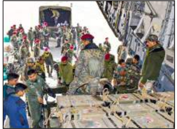
નવીદિલ્હી તા.૭ તુર્કીમાં આવેલા વિનાશકારી ભૂકંપના પીડીતોની વહારે ભારત આચ્યુ છે. ભારતે ભૂકંપ રાહત સામગ્રીની બે ખેપ મોકલી છે. પ્રધાનમંત્રી કાર્યાલય તરફથી કરવામાં

આવેલ જાહેરાત બાદ કેટલાક ડોગ સ્કવોડ, તબીબી સાથે કલાકમાં જ આ ભૂકંપ રાહત સામગ્રી જોડાયેલ વસ્તુઓ, ડ્રીલીંગ તુર્કીને ભારતીય વાયુસેનાના વિમાન ઉપકરણ અને સહાયતા પ્રયાસ