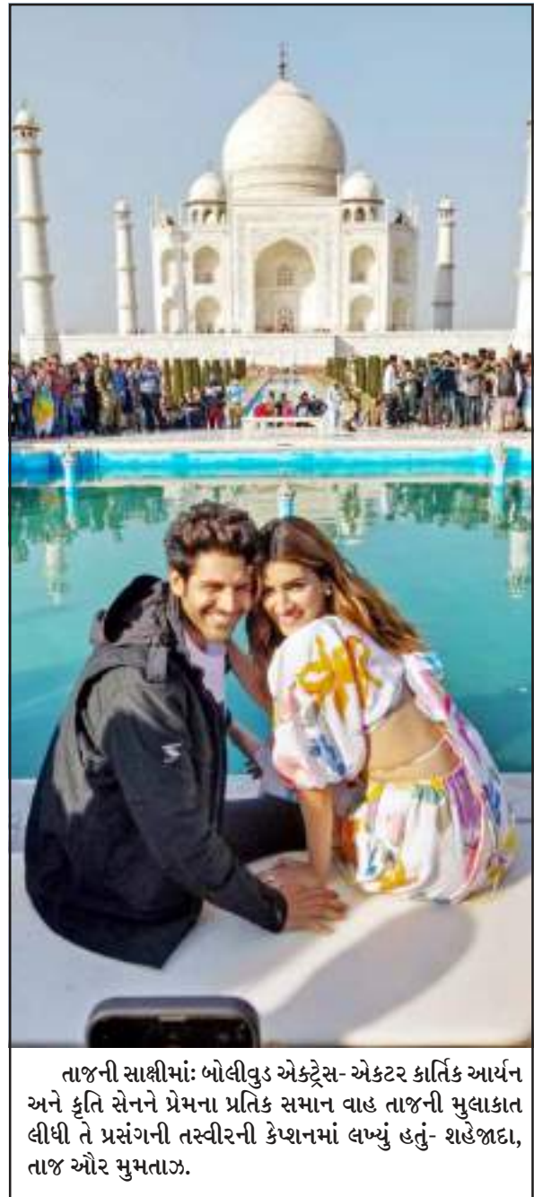
તાજની સાક્ષીમાં બોલીવુડ એક્ટ્રેસ-એક્ટર કાર્તિક આર્યન અને કૃતિ સેનને પ્રેમના પ્રતિક સમાન વાહ તાજની મુલાકાત લીધી તે પ્રસંગની તસવીરની કેપ્શનમાં લખ્યું હતું- શહેજાદા, તાજ ઓર મુમતાઝ.

શોષિંગ કરવા સહિતની ઈનડોર અને આઉટડોર એક્ટિવિટી કરતી તેમજ સફેદ રણમાં સુચસ્તિ સમયે ટ્રેડિનશલ આઉટફિટમાં પોઝ આપતી જોવા મળી. ભુજમાં ૩૫ હજાર સ્ક્વેર ફીટમાં ફેલાયેલું સ્વામિનારાયણ પણ ત્યાંના મુલાકાતીઓ માટે આકર્ષણનું કેન્દ્ર છે. દેવોલિના ભટ્ટાચાર્જને આ મંદિરની મુલાકાત લીધી હતી અને ભગવાન સમક્ષ શીશ નમાવી ધન્યતા પ્રાપ્ત કરી હતી. તેણે ત્યાં ક્લિક કરાવેલી તસવીરો ઈન્સ્ટાગ્રામ પર શેર કરી છે, જેમાં તે પેસ્ટલ ગ્રીન ડ્રેસ-પાયજામાં જોવા મળી. આ પોસ્ટની સાથે તેણે મંદિર વિશેની કેટલીક માહિતી પણ આપી છે. તેણે અન્ય જે વીડિયો શેર કર્યો છે, જેમાં તે અલગ-અલગ એક્ટિવિટી કરતી જોવા મળી. આ ક્લિપમાં રણોત્સવની સુંદરતા જોતા જ આંખને ગમી જાય તેવી છે. અલગ-અલગ એક્ટિવિટી સિવાય ટેન્ટમાં બેસીને પરંપરાગત ભોજનનો આનંદ લેતી પણ જોવા મળી. આ વીડિયોની સાથે પણ તેણે રણોત્સવની પૂરતી માહિતી લખી છે અને અહીંયાની મુલાકાત લેનારા લોકો શું-શું કરી શકે છે તે વિશે જણાવ્યું છે.