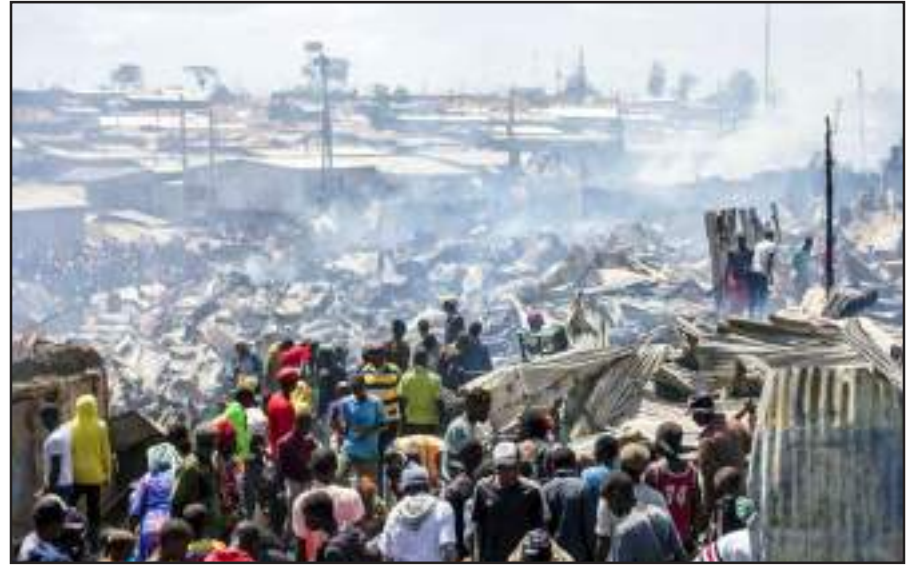
કેન્યાના પાટનગર નેરોબીમાં આવેલા આફ્રિકાના સૌથી મોટા સ્વમ વિસ્તાર કિબેરામાં મંગળવારે લાગેલી ભીંધણ આગમાં સંખ્યાબંધ મકાનો- ઝૂંપડા બળીને ખાક થઈ ગયા હતા. આગના બનાવમાં જાનહાની થયાના કોઈ અહેવાલ હજુ સુધી મળ્યા નથી, આગના સ્થળે એકત્ર થયેલી સ્થાનિક લોકો તેમના સળગીને ખંડેરમાં ફેરવાઈ ગયેલા મકાનોને નિહાળી રહ્યા છે.

આ રાહત સામગ્રી મોકલવાનું પગલું વડાપ્રધાન મોદી દ્વારા અસરગ્રસ્ત દેશને દરેક સંભવ મદદ કરવાના નિર્દેશ બાદ ઉઠાવાયુ હતું. જાણવા મળતી વિગત મુજબ ૧૦૦ સભ્યોની બે એનડીઆરએફ ટીમ ટ્રેઈનડ થાનો અને જરૂરી સાધનો સાથે તુર્કીમાં ભૂકંપ અસરગ્રસ્ત વિસ્તારમાં ખોજ અને બંધાવ અભિયાન માટે મોકલાઈ છે. મેડીકલ ટીમની સાથે જરૂરી દવાઓ પણ મોકલાઈ છે.