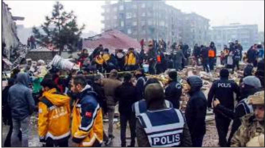
કારણે બંધાવ અને રાહત કાર્યમાં પરેશાની થઈ રહી છે. હાલમાં તુર્કીનું ઘટનાસ્થળે પહોંચવામાં પરેશાનીનો સામનો કરવો પડે છે. અમેરિકી એવા સમયે આવ્યો હતો. જયારે પશ્ચિમ એશીયા બર્કીલા તોફાની

૧૯૯૯ માં તુર્કીમાં ભૂકંપમાં ૧૭ હજાર લોકોના મોત થયેલા: આ પહેલા તુર્કીમાં વર્ષ ૧૯૯૯ માં ૭.૪ ની તીવ્રતાનો ભૂકંપ આવ્યો હતો. એ ભૂકંપમાં ઇસ્તંબુલમાં લગભગ ૧ હજાર લોકોના મોત થયા હતા. જયારે કુલ મોત ૧૭ હજારથી વધુ લોકોનાં થયા હતા.