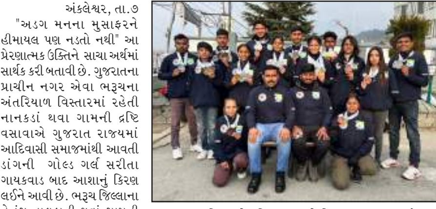
ભરૂચ જિલ્લાને દ્રષ્ટિ વસાવાએ વિશ્વના ફલક પર ચૌરવ આપવ્યું હતું.

તેમજ ટીમ અને ઈન્ડિવિજ્યુઅલ ડિસ્ટન્સમાં ૨ ગોલ્ડ અને ૧ સિલ્વર મેડલ મેળવી લમી આઈસ સ્ટોક વિન્ટર નેશનલ ચેમ્પિયનશિપ-૨૦૨૩માં ગુજરાત રાજ્યનું પ્રતિનિધિત્વ દ્રષ્ટિ વસાવાએ કરનારી પ્રથમ રમતવીર બની છે. વયુમાં આવનારા વર્ષ ૨૦૨૬માં દરિયાપાર યોજનાર ઓલમ્પિકમાં ભારત દેશ તરફથી પ્રથમવાર યજમાની કરશે. માતા -પિતાના વિશ્વાસને સાચા અર્થમાં સાચક કરી બતાવીને તેનું પરિણામ આ રમતમાં પોતાના કોષ્ટાનું કૌતવ બતાવીને લમી નેશનલ આઈસ સ્ટોક સ્પોર્ટ્સ ચેમ્પિયનશિપમાં સતત ત્રીજી વખત મેડલ મેળવીને ઉત્કૃષ્ટ ઉદાહરણ પૂરું પાડ્યું છે.