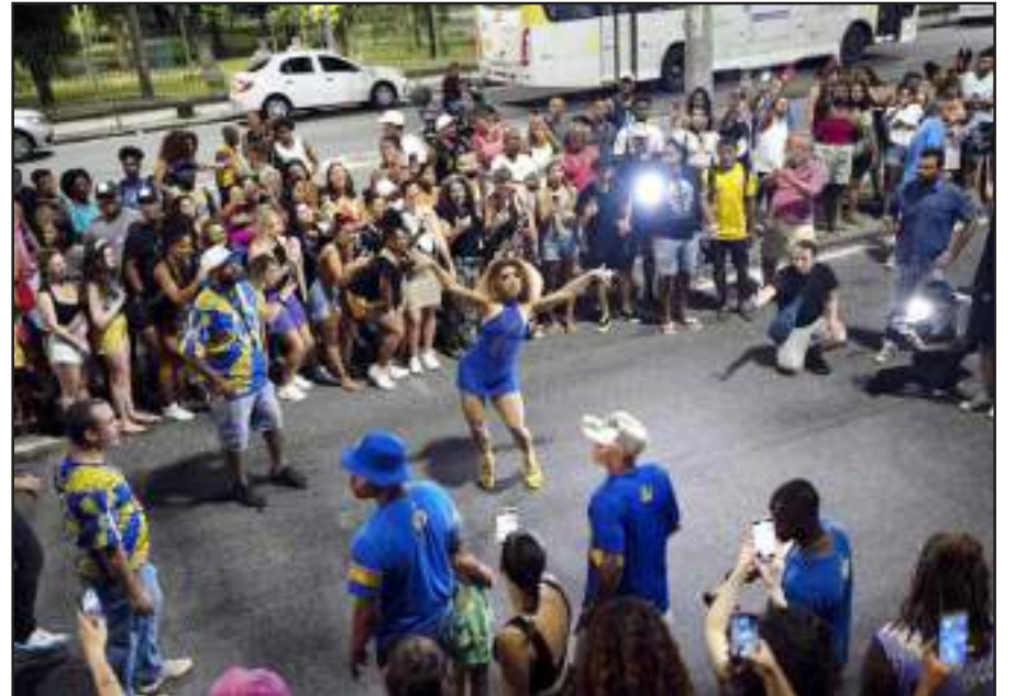
લેટિન અમેરિકાના દેશ બ્રાઝિલના રિઓ ડીજાનેરો શહેરમાં આગામી રિઓ ડી જાનેરો કાર્નિવલ પાર્ટીના યોજાયેલા રિલસલ દરમિયાન) પરીઈસો ડુ ટ્યુટી સામ્યા સ્કૂલની ડ્રમ કવીન મચારા વિમાં ભાગ લેતી પરફોર્મ કરી રહી છે.

આ ભૂકંપને કારણે અનેક દેશોને ખળભળાવી મુક્યા હતા. આ ભૂકંપની તીવ્રતા ૯.૫ ની હતી. ૧૨ હજારથી વધુ લોકોનાં જીવ ગયા હતા. ૧૯૬૪ (અલાસ્કા): ૨૭ માર્ચ ૧૯૬૪ માં અમેરિકાનાં અલાસ્કામાં ૯.૩ ની તીવ્રતાનો ભૂકંપ આપતા પતાના મહેલની જેમ લાખો ઘર તૂટી પડ્યા હતા. આ ભૂકંપમાં ૨૦૦ જેટલાં લોકોનાં મોત થયા હતા. ૨૦૦૧ (ભુજ-ગુજરાત): ૨૬ જાન્યુઆરી ૨૦૦૧ માં ગુજરાતમાં આવેલા ભૂકંપે કચ્છ-ભુજમાં ભારે તબાહી મચાવી હતી. આ ભૂકંપની તીવ્રતા ૭.૭ હતી. કચ્છ અને ભુજમાં ૨૦ હજારથી વધુ લોકો માર્યા ગયા હતા. ૨૦૦૪ (ઈન્ડોનેશીયા): ૨૦૦૪ માં ઈન્ડોનેશીયામાં સુમાત્રામાં ૯.૨ ની તીવ્રતાનાં ભૂકંપમાં