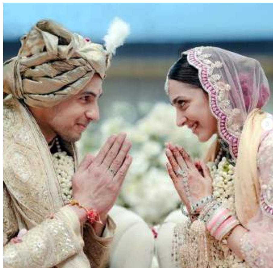
જેસલમેરમાં આજે સૂર્યગઢ રિસોર્ટ ખાતે બોલિવુડ સેલિબ્રિટી કિઆરા અડવાણી અને સિદ્ધાર્થ મલહોત્રા લગ્નના બંધને બંધાયા હતા. સાત ફેરા ફર્યા બાદ એકબીજાને મન વચન અને કર્મથી જોડાવાની શુભેચ્છાની આપલે કરી હતી.

શકી નહીં. મેં શોમાં ૨૦૦ ટકા આપ્યા હતા. હું તમને હંમેશા મનોરંજન પૂરું પાડીશ તેવું વચન આપું છું. સુખ્યુલના પિતાએ મારા માટે જે વાત કહી તેને અવગણવી મુશ્કેલ છે. તેમણે જે વાત કહી તેને અવગણી શકાય નહીં. સુખ્યુલ વિશે મેં જે કંઈ કહ્યું તે અવલોકન કરીને કહ્યું હતું. મને નથી લાગતું કે હું ખોટી હતી. આ શો એવો છે જ્યાં તમારે પોતાના મત શેર કરવા પડે છે અને તે સિવાય તમે કંઈ કરી શકતા નથી. તમને તમારો મત રાખવાનો પૂરતો હક છે. મને લાગે છે કે જે કંઈ થયું તે સુખ્યુલના તરફેણમાં હતી કારણ કે હવે જે સુખ્યુલને જોઈએ છીએ તે પહેલા કરતાં અલગ છે. સુખ્યુલ હવે એકદમ અલગ વ્યક્તિ બની ગઈ છે. તે સુંદર વ્યક્તિ છે અને પોતાનો પક્ષ રાખવા લાગી છે. શાલિન તેવું દેખાડી રહ્યો હતો કે, તેની દયાથી સુખ્યુલ ઘરમાં છે. તે તેની સાથે છળકપટ કરી રહ્યો હતો. હું તેને કેવી રીતે કહેત કે તે પોતાના દમ પર આ શોનો ભાગ છે. તે પોતાની ઉપલબ્ધિના કારણે ઘરમાં છે. શાલિન હંમેશાથી મારી પાછળ હતો અને શોમાં તે મને ઈમ્પ્રેસ કરવામાં રહેતો હતો. બાદમાં અમે સારા મિત્રો બન્યા હતા. ઘરમાં રહીને શાલિન ભનોત રિયલમાં શું છે તે જાણવા મળ્યું. તે ચાલાક છે. તે કેટલો ગુસ્સાવાળો છે એ વાત કોઈનાથી છુપી નથી. ગુસ્સામાં વસ્તુઓ ફેંકવી અને તેને તોડી નાખવી..