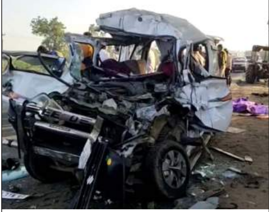
(તસ્વીર અને અહેવાલ સંજય ગાંધી-શામળાજી, અદ્વૈતાબ દુરાની-મોડાસા અને ફરુક ચૌહાણ-વઢવાણ)

મોડાસા, તા. ૭ અરવલી જિલ્લાના મોડાસા તાલુકાના વોલ્વા ગામના પરિવારની ઈકો કાર લીમડી-રાજકોટ હાઈવે પર ટ્રક સાથે અથડાતા કારનો કચ્ચરઘાણ નીકળી ગયો હતો. કારમાં સવાર પિતા, બે પુત્ર અને ભત્રીજાનું ઘટના સ્થળે મોત થયું હતું.