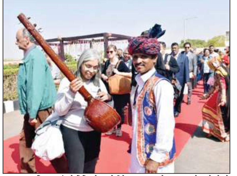
જી-૨૦ સમિતિ અનુસંધાને વિવિધ દેશના ડેલીગેટ્સ કચ્છના મહેમાન બન્યા છે ત્યારે ધોરડો સફેદરણ ખાતે કેમલ સફારી અને સાંસ્કૃતિક કાર્યક્રમની ઝાંખીઓ રજૂ કરીને તેમનું કચ્છી પરંપરા મુજબ સ્વાગત કરવામાં આવ્યું હતું.

હતી. ગુજરાત પંચાયત સેવા પસંદગી મંડળ દ્વારા તાજેતરમાં લેવાયેલી જુનીયર કલાર્કની પરીક્ષાનું પેપર લીક થયું હતું. તે બાબતે આગામી બજેટ સત્રમાં રાજ્ય સરકારનું નવું વિધેયક રજૂ કરશે તેમ જણાવી મંત્રી ઋષિકેશ પટેલે ઉમેર્યું હતું કે, ૩ થી ૭ વર્ષની સજાની જોગવાઈ સાથેનું વિધેયક લાવવામાં આવશે. પેપર લીક કરનાર અને લેનાર બંનેની સામે કડક કાર્યવાહી કરતું વિધાયક લવાશે સરકારી પ્રેસમાં પેપર છાપવા બાબતે પણ વિચારણા કરાશે.